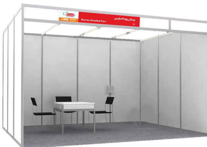
شکل ۱- نمونه غرفه بندی استاندارد با پانل (اکتانورم)

این نوع از سازه ها که در فضاهای داخلی و سالن های نمایشگاهی کاربرد دارند، شامل پانلهایی در ابعاد ۲۷۰*۱۰۰ سانتی متر بوده که دیواره ها را شامل می شوند. سر درب غرفه نیز مطابق شکل ۱ کتیبه نام شرکت نصب می شود.