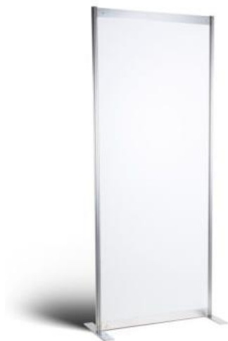
شکل ۲ - نمونه پانل جهت تفکیک فضای داخل غرفه