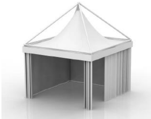
شکل ۴ - نمونه غرفه‌بندی استاندارد با چادر نمایشگاهی

این نوع از سازه‌ها به دلیل نوع ساختار اصلی آن و بادبندها، در مقایسه با سازه داربستی و اسپیس فریم، از استحکام و مقاومت بالاتری برخوردار بوده و مناسب فضاهای باز می‌باشد.